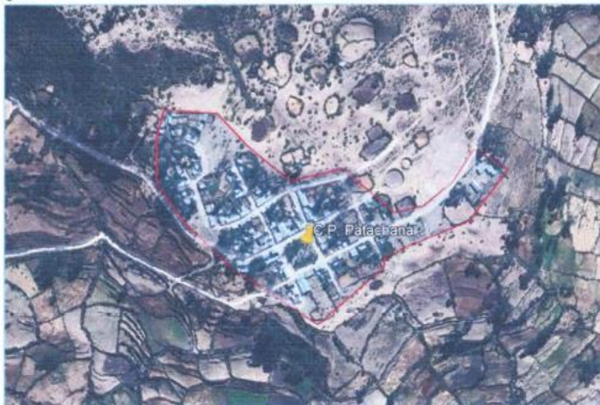
Ubicación del C.P. Patachana

El sistema de agua Potable es un papel importante en el desarrollo y bienestar de la sociedad, la actual política nacional toma muy en cuenta este punto y plantea como objetivo general mejorar la calidad de vida de la población a través de un mejoramiento del sistema de agua potable en el centro poblado Patachana.