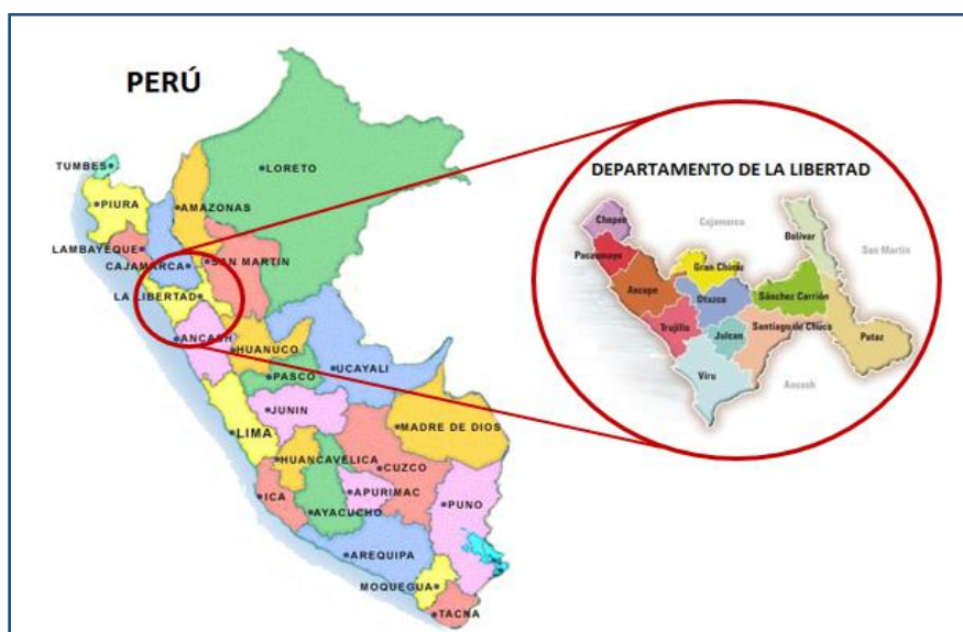
IMAGEN 01. UBICACIÓN GEOGRÁFICA DE LA REGIÓN LA LIBERTAD

Región geográfica : Sierra Coordenadas UTM : Zona 17 826129.37 E 9134280.97 N