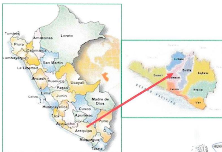
Imagen 02. Mapa de ubicación macrorregional.