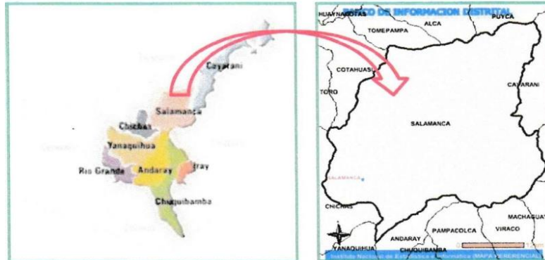
Imagen 03. Mapa de ubicación microrregional.

"Año de la unidad, la paz y el desarrollo"