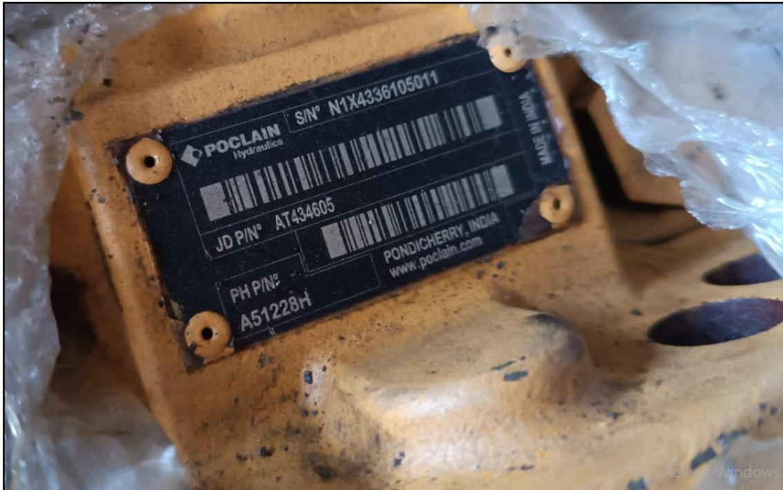
IMAGEN DEL MINI CARGADOR