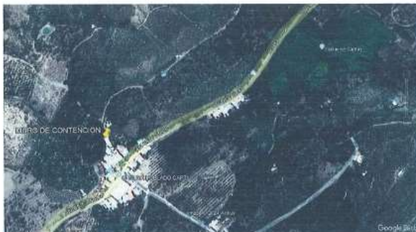
Vista del Área de Intervención del Proyecto