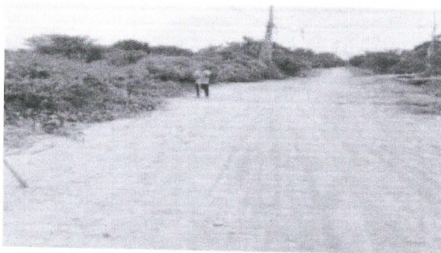
Foto 1.-Prolongación Av.Froilan a nivel de terreno natural

“Año del Bicentenario, de la consolidación de nuestra Independencia, y de la conmemoración de las heroicas batallas de Junín y Ayacucho”