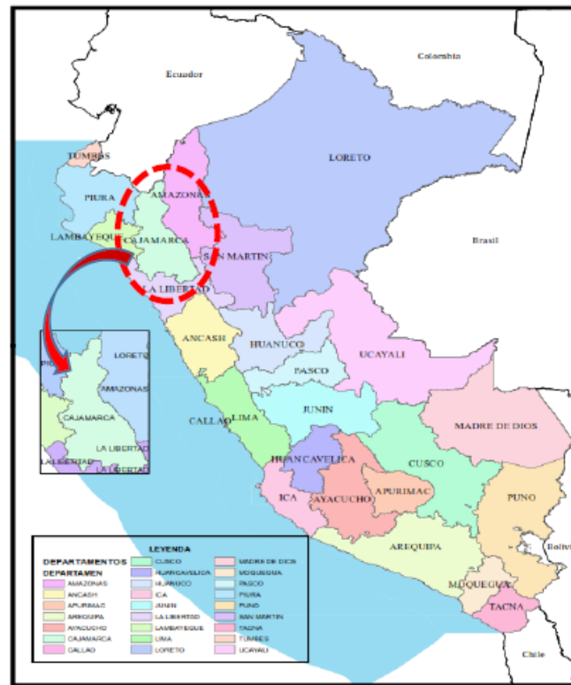
IMAGEN N°1. UBICACIÓN EN EL PAÍS: REGIÓN CAJAMARCA

La vía, considerada en el presente proyecto se encuentra ubicada dentro de la localidad de Cutervillo y El Molle, Distrito de Huambos, Provincia de Chota – Región Cajamarca.