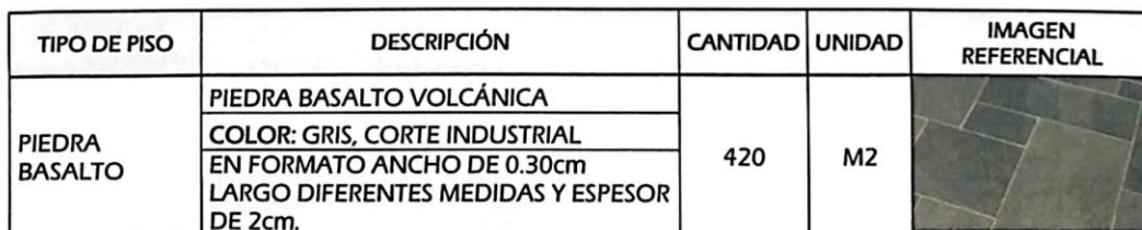
Imagen 2: DESCRIPCIÓN DE PISO -PIEDRA BASALTO