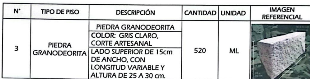
imagen 3: DESCRIPCIÓN DE PISO-PIEDRA GRANODEORITA

La cuarcita está constituida por cristales de cuarzo cristalino: íntimamente soldados, a menudo endentados y entrelazados. Es una roca metamórfica no foliada de origen sedimentario, formada por la consolidación con cemento silíceo de areniscas cuarzosas. Es de gran dureza, frecuente en terrenos paleozoicos.