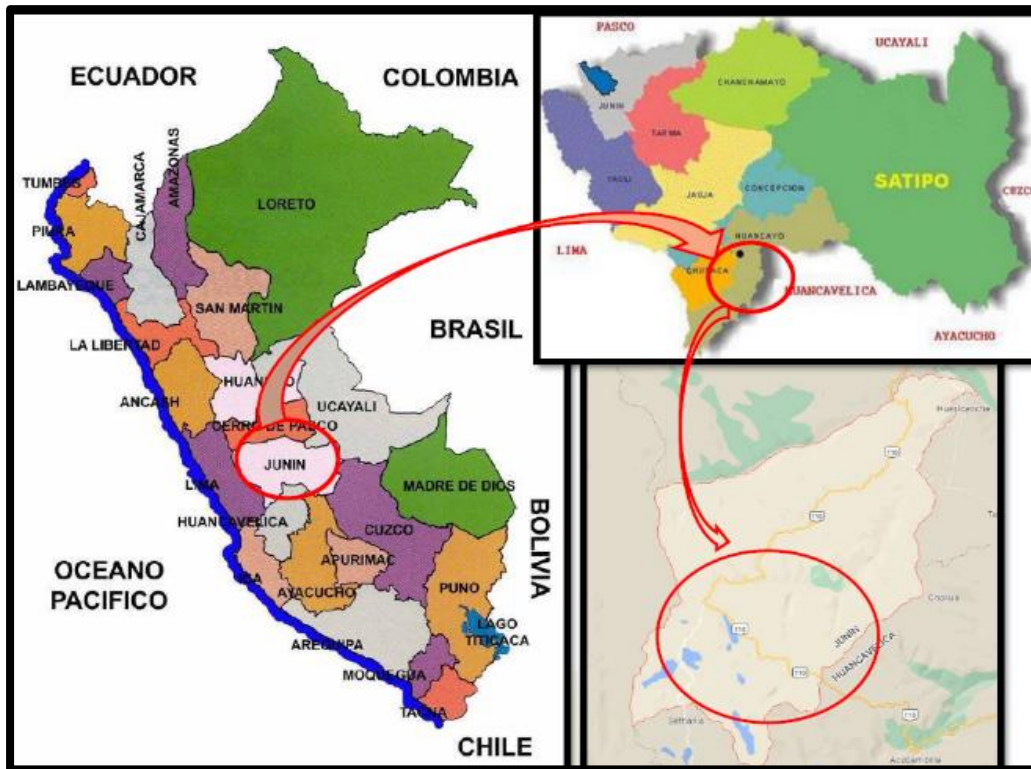
Imagen N° 01: Ubicación y Localización del ámbito del Proyecto

El Mapa 01 indica el lugar del estudio en la Provincia de Huancayo de la región Junín.