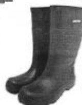
Bota de Jebe

Equipos de Protección Personal (EPPs) los cuales deberán ser reemplazados de acuerdo a la necesidad. En el caso de los cascos de protección estos deben cumplir con los requisitos de absorción de impacto y resistencia a la penetración el personal de mantenimiento deberá usar cascos de color anaranjado, mientras que de los jefes de mantenimiento deberá ser color azul.