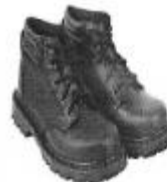
Zapato de seguridad Puntera Acero