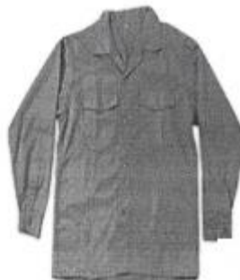
Uniforme de Mantenimiento