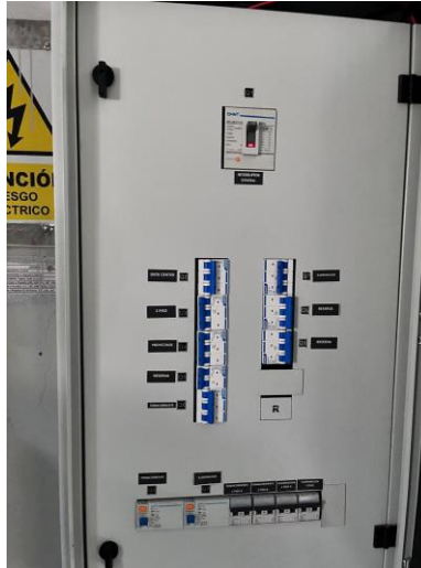
Figura: Tablero general eléctrico ubicada en el primer piso