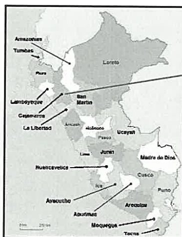
UBICACIÓN EN EL PERU