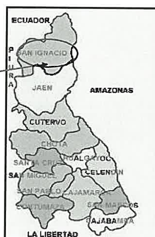
UBICACIÓN EN LA REGION CAMAJARCA