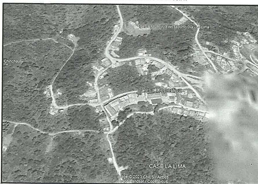
IMAGEN 01: UBICACION DEL PROYECTO