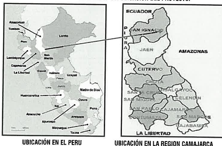
GRAFICO N° 01: UBICACIÓN DEL PROYECTO.