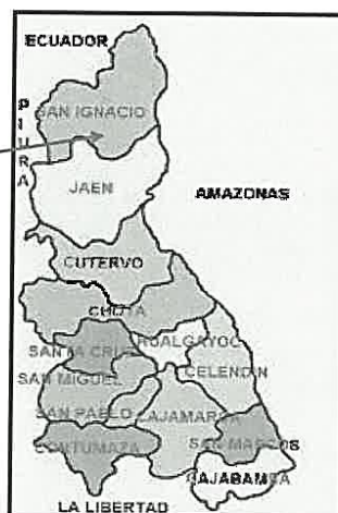
UBICACIÓN EN LA REGION CAMAJARCA