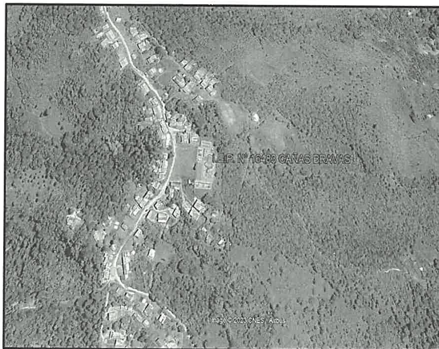
IMAGEN 01: UBICACION DEL PROYECTO