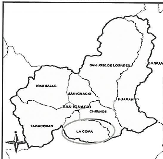
UBICACION EN EL DISTRITO DE LA COIPA