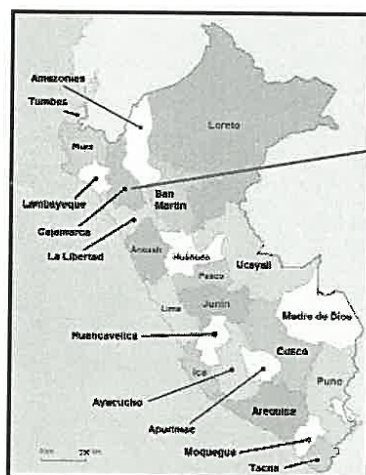
UBICACIÓN EN EL PERU