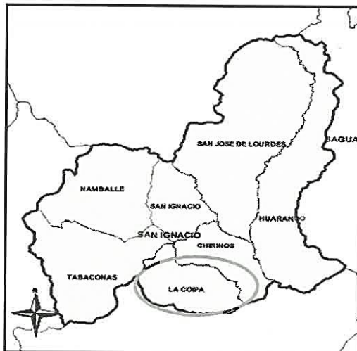
UBICACION EN EL DISTRITO DE LA COIPA