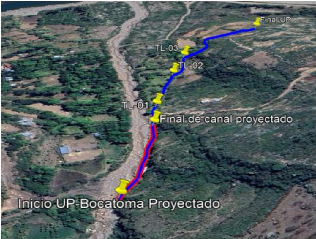
Imagen 3: Imagen satelital de la ubicación del proyecto – Canal de riego.

El proyecto se encuentra ubicado aproximadamente a 107.1 km tomando como referencia a la ciudad de Ayacucho. La infraestructura vial intercomunal es precaria y en su mayoría es inexistente a nivel interdistrital e interprovincial. El acceso a la zona del proyecto desde la ciudad de Ayacucho (capital de región Ayacucho) es como sigue: