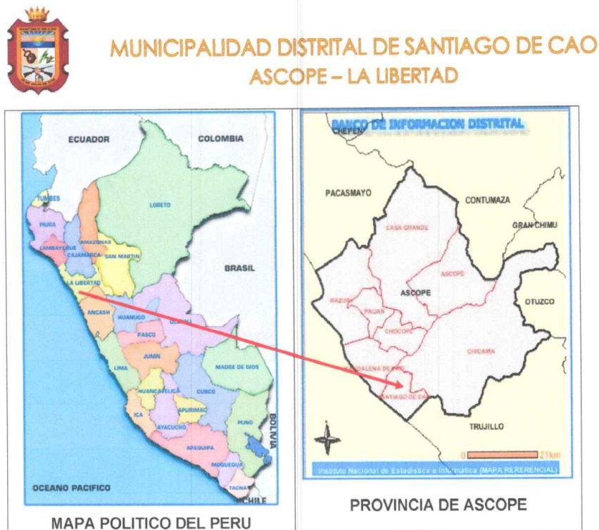
IMAGEN N°02. Mapa Político del Distrito de Santiago de Cao y ubicación satelital del lugar que comprende el proyecto.