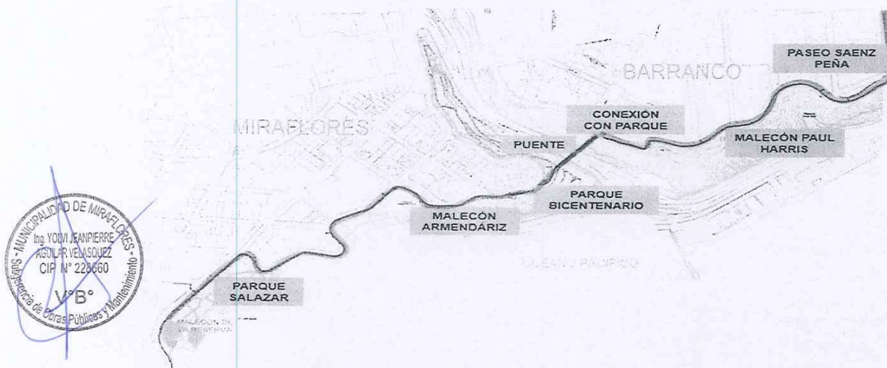
Imagen N° 01: Plano de Ubicación del proyecto

Para describir las características arquitectónicas del "Mejoramiento y Ampliación de Los Servicios Turísticos Corredor Turístico Malecón de la Reserva Altura Parque Salazar (Miraflores) - Paseo Sáenz Peña (Barranco) Miraflores del Distrito de Miraflores - Lima - Lima", ver Figura 2.