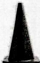
CONO DE SEGURIDAD