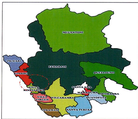
MAPA N° 3 UBICACIÓN DISTRITAL Y CENTROS POBLADOS