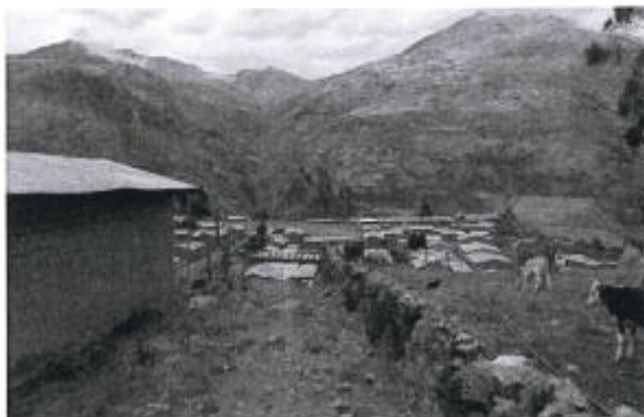
Figura: Topografía del Centro Poblado menor Cochas.