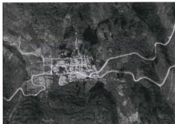
Figura 1. Ubicación del Centro Poblado de Cochas.