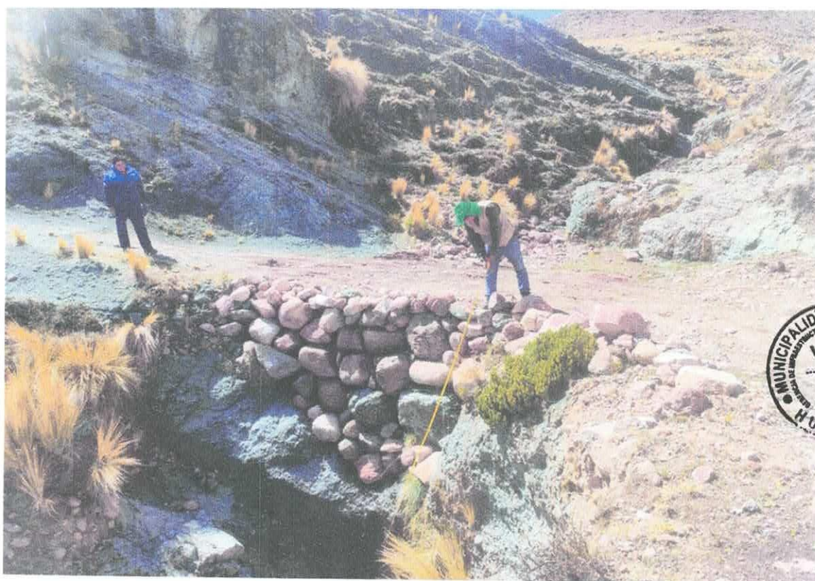
Foto N°08.- Vista de los caminos vecinales con obras de arte rudimentario en épocas de lluvias son intransitables (Km 0+960.50)

ya que muchas veces llegan retrasándose en el horario y muy cansados pese a que tienen que levantarse muy temprano y emprender largas caminatas para ganarle al tiempo, desmotivando su desenvolvimiento con los docentes, estas inadecuadas condiciones de transitabilidad genera pérdida de tiempo en los estudiantes, reduciendo las posibilidades de estudiar, hacer tareas y complementar lo aprendido en clase. Por estas dificultades muchos alumnos optan por dejar de estudiar y ponerse a trabajar ayudando a sus padres en la agricultura u otras actividades perjudicando su nivel de aprendizaje, dándole cabida aún más al analfabetismo.