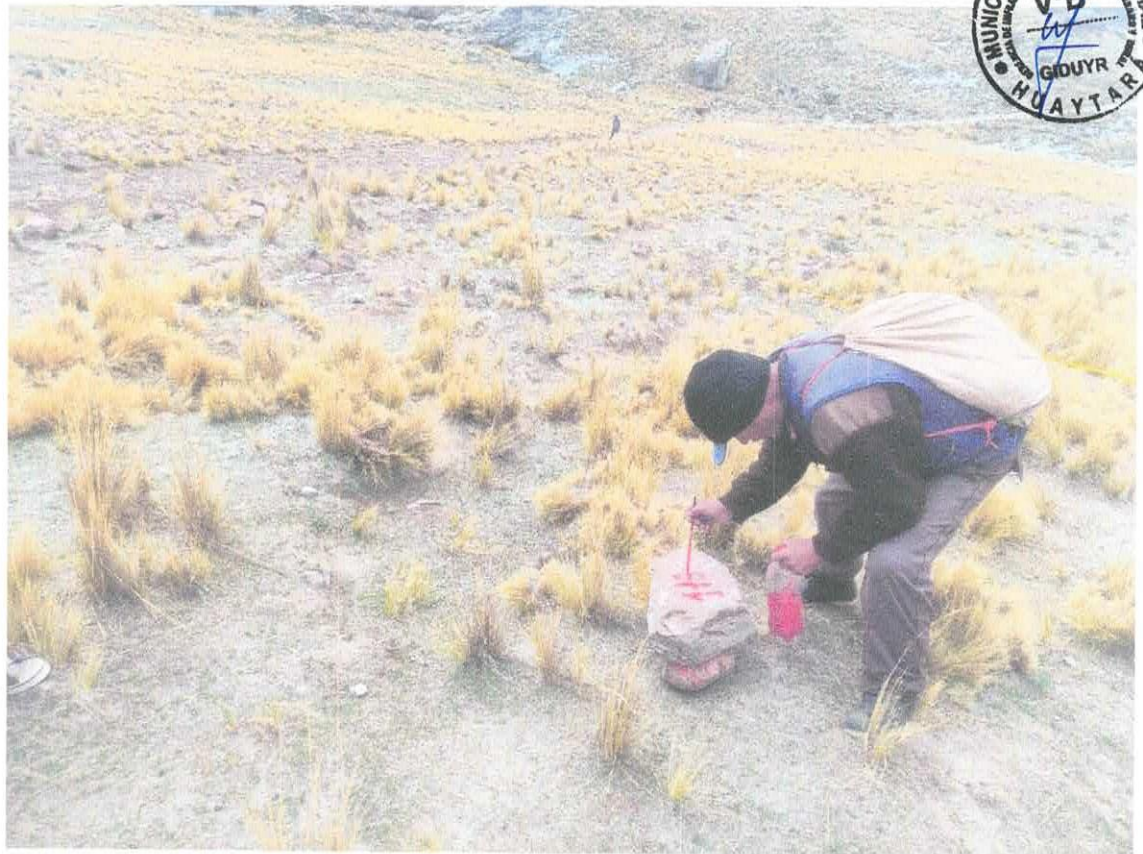
Foto N 07.- Vista del camino vecinal deteriorado que dificulta el transporte de carga y pasajeros son intransitables.

cualquier accidente grave u enfermedades, en la mayoría de los casos, necesitan ser evacuados al puesto de salud más cercano y como en estas comunidades no se cuenta con equipos necesarios para brindar servicios de salud de calidad, tienen que ser evacuados al centro de salud de Pilpichaca y Santiago de Chocorvos, y si son emergencias mortales son referidos al hospital regional de Huancavelica, pero la dificultad en la accesibilidad vehicular a estas zonas aumenta el riesgo de mortalidad de las personas, dificultando el traslado rápido de los enfermos porque solo se tiene herraduras por donde transitan los pobladores que son largas horas de caminata y muy dificultosos.