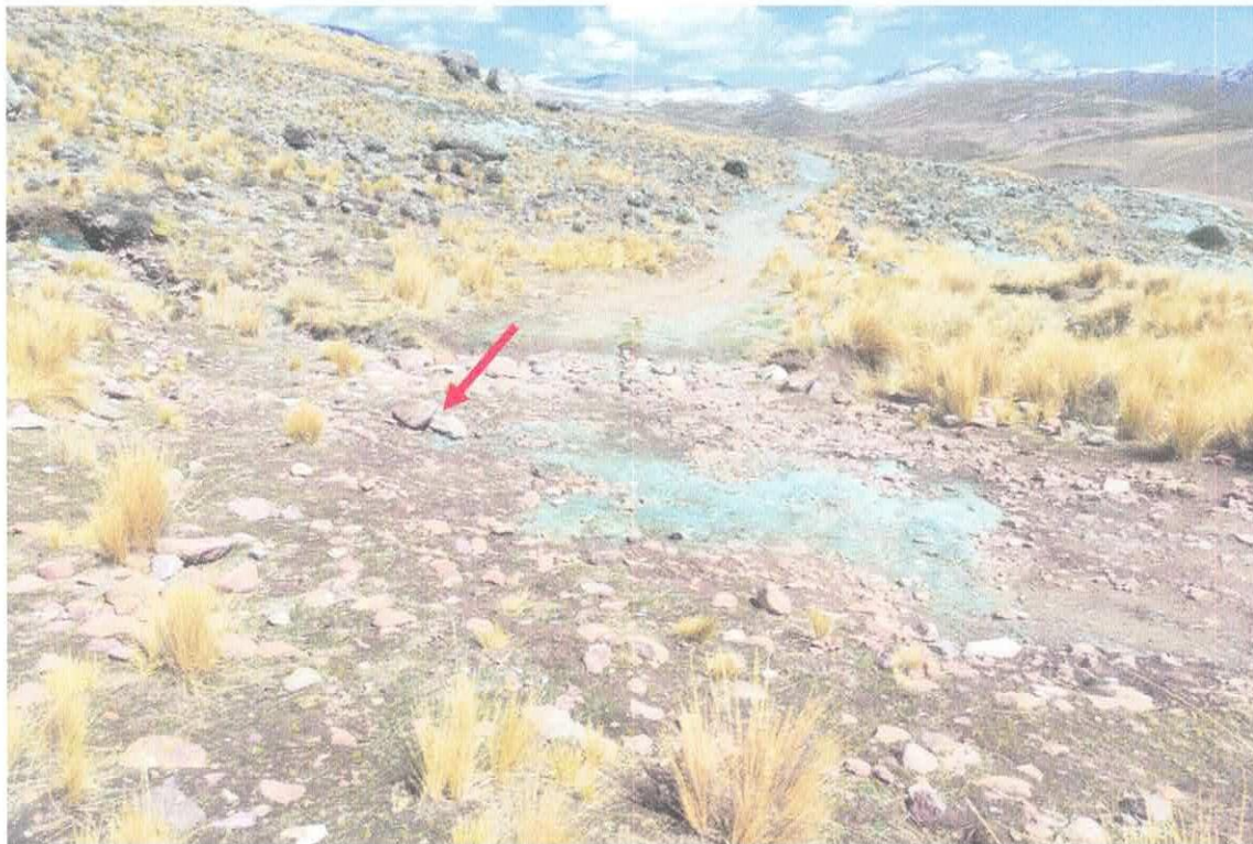
Foto N° 02.- Caída material aluvial que acumula en la plataforma de rodadura. Que son intransitables en temporadas lluviosas