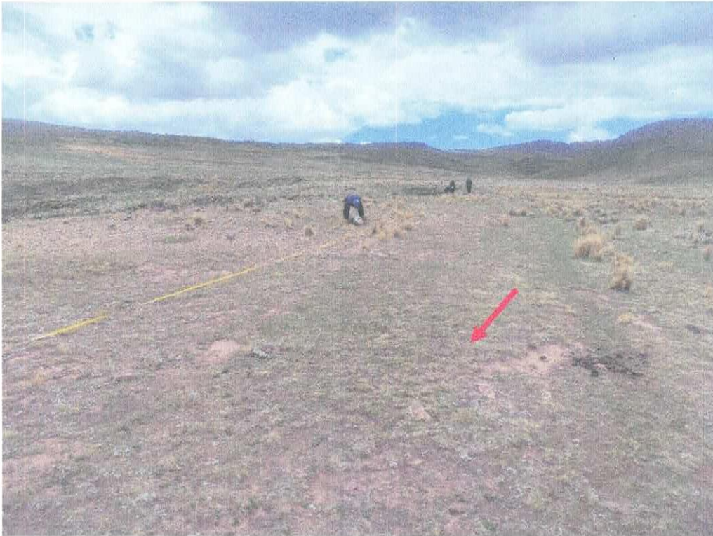
Foto N° 01.- Plataforma de rodadura con presencia abundante de rocas pequeñas que hacen intransitable.