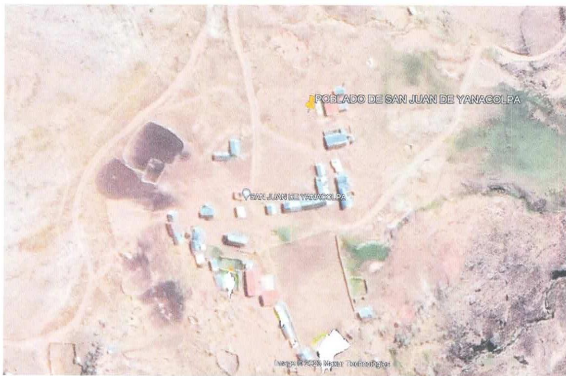
Mapa N°05: Vista satelital de la comunidad de San Juan de Yanacolpa