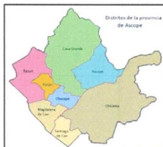
Figura N° 01