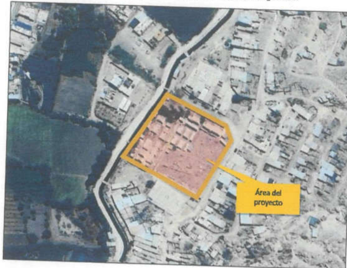
GRÁFICO 2: Ubicación geográfica del proyecto mediante Google Earth