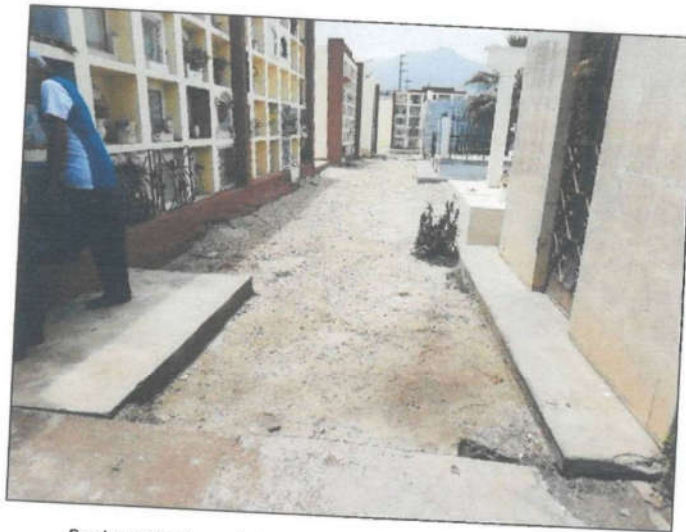
Se observa las áreas de circulación en mal estado y veredas sin revestir