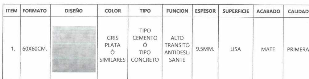
Tabla 3. Características técnicas de porcelanato 60 cm X 60 cm.