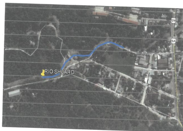
CROQUIS DEL TRAMO A INTERVENIR