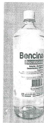
Figura referencial de la bencina rectificada x 1 litro