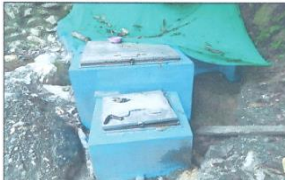
IMAGEN N° 08: VISTA PANORÁMICA DE LA CAPTACIÓN

"Año del Bicentenario, de la consolidación de nuestra Independencia, y de la conmemoración de las heroicas batallas de Junín y Ayacucho"