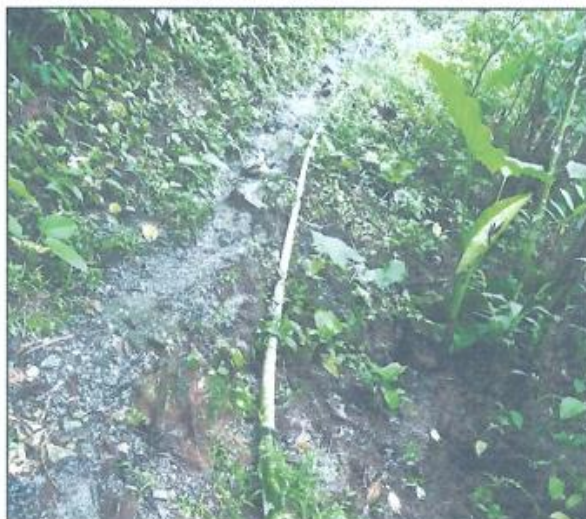
IMAGEN N° 09: VISTA PANORÁMICA DE LA LÍNEA DE CONDUCCIÓN

"Año del Bicentenario, de la consolidación de nuestra independencia, y de la conmemoración de las heroicas batallas de Junín y Ayacucho"