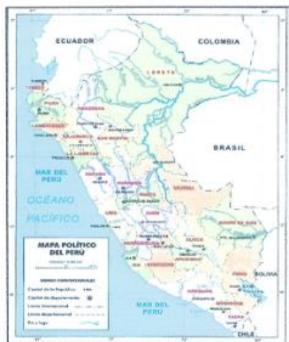
IMAGEN N° 1: Mapa Político del Perú.