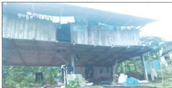
IMAGEN N° 07: VIVIENDAS EN LA LOCALIDAD SHUCHSHUYACU

"Año del Bicentenario, de la consolidación de nuestra Independencia, y de la conmemoración de las heroicas batallas de Junín y Ayacucho"