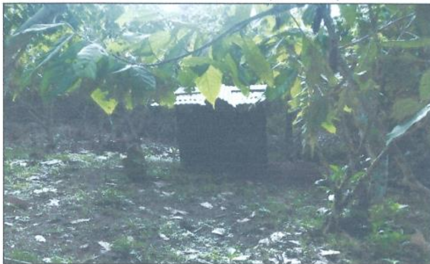
IMAGEN N° 12. UBS EXISTENTES (POZO CIEGO)

En su superficie cuenta con un piso de madera u otro material rústico, son muy antihigiénicos, sin privacidad, algunos cuentan con paredes de calamina, plástico y otras de madera; por la falta de conocimiento y desinterés de la población no cuentan con una debida operación y mantenimiento.