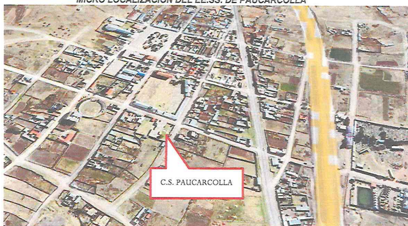
FIGURA Nº 01 MICRO LOCALIZACIÓN DEL EE.SS. DE PAUCARCOLLA

En el siguiente grafico podemos observar el mapa de macro localización donde se puede identificar donde se ubica en el distrito de Paucarcolla.