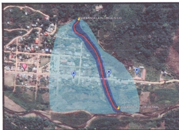
CROQUIS DEL TRAMO A INTERVENIR