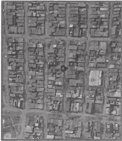
Figura N°1: Ubicación de la I.E. N°139.

El perfil del proyecto indica que se construirán las siguientes áreas: