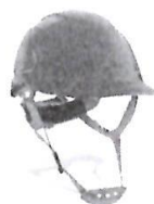
Casco de Seguridad