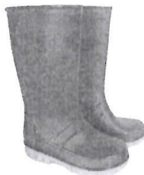
Botas de Jebe