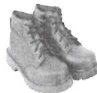
Zapatos de Seguridad con Puntera de Acero