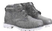
Botines cortos de Jebe