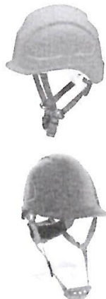
Casco de Seguridad