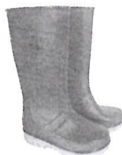
Botas de Jefe