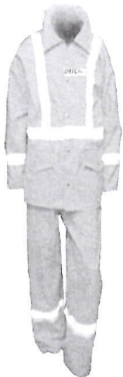
Uniforme de Mantenimiento

"AÑO DE LA RECUPERACIÓN Y CONSOLIDACIÓN DE LA ECONOMÍA PERUANA"