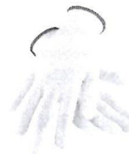
Guantes de Seguridad de Obra