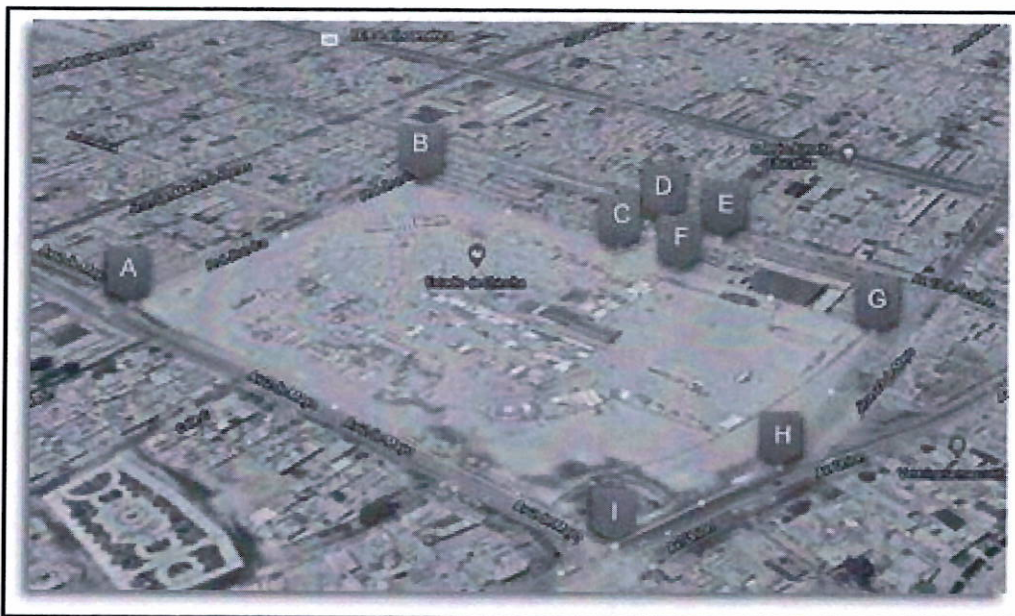
Imagen N° 1: Ubicación del proyecto con CUI N° 2649526.

Departamento : Ica Provincia : Chincha Distrito : Pueblo Nuevo Sector : Estadio Félix Castro Tardio