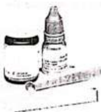
Fig. 1: kit ionómero de vidrio fotocurable para restauración.