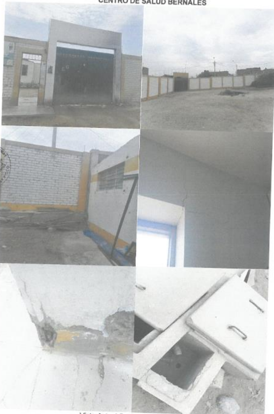
Vista Actual Centro de Salud Bernal