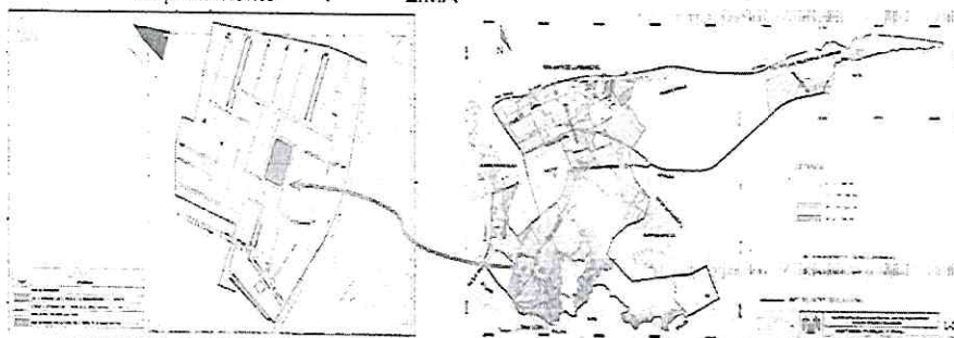
LOCALIDAD: P.J PRO-VIVIENDA EL AGUSTINO I ZONA.

Lugar : P.J. Pro-Vivienda El Agustino I zona. Distrito : EL AGUSTINO Provincia : LIMA Departamento : LIMA