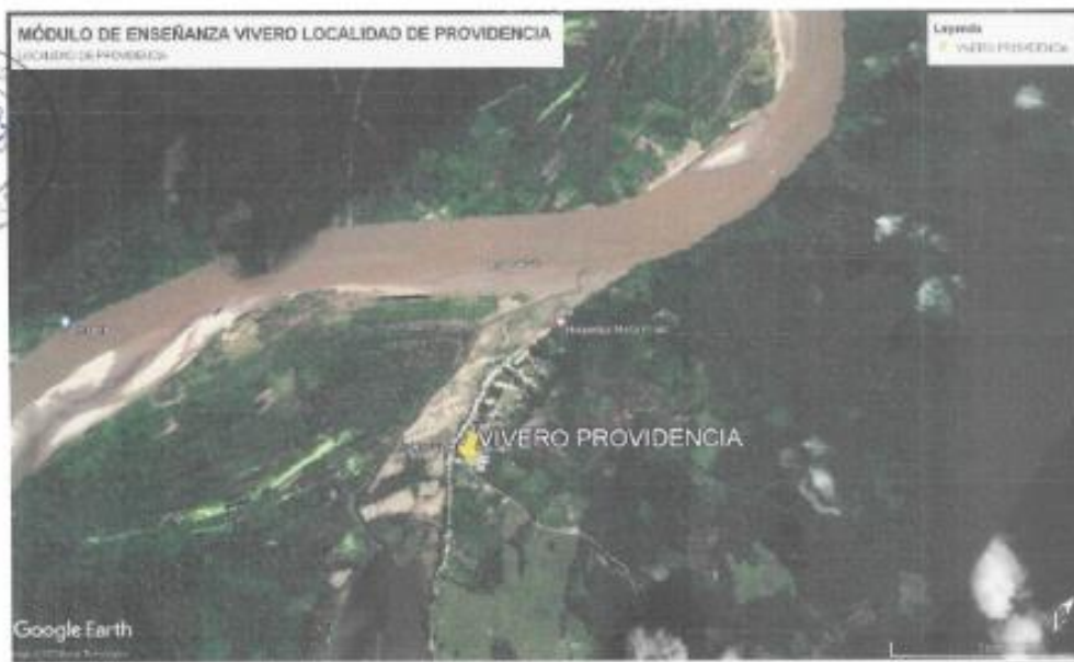
Figura 01: Ubicación de módulo de vivero – Localidad Providencia