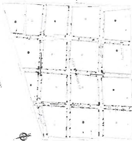
Figura 01 - Zona del Proyecto.