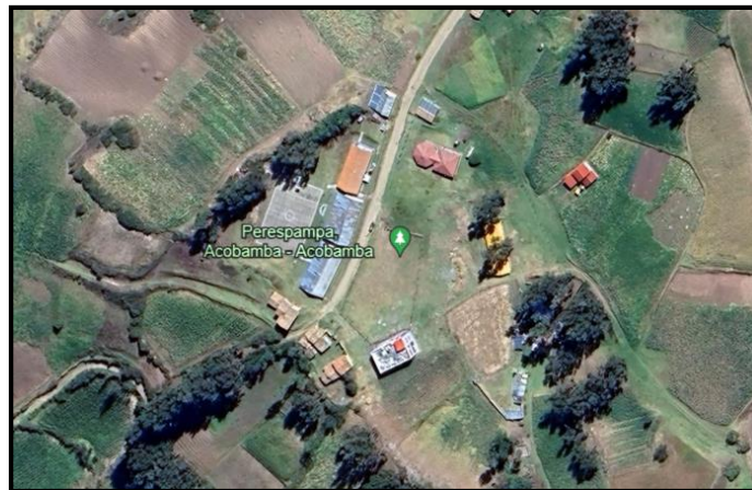
VISTA SATELITAL DEL TERRENO DEL PROYECTO

El proyecto consiste en la construcción de la infraestructura deportiva, con tecnología apropiada de acuerdo a las condiciones socioeconómicas, topográficas y geológicas teniendo en cuenta el impacto ambiental además de ello contará con: