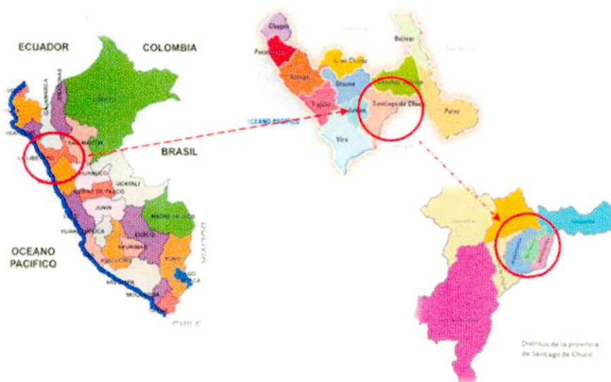
Figura2. Mapa de la Provincia de Santiago de Chuco