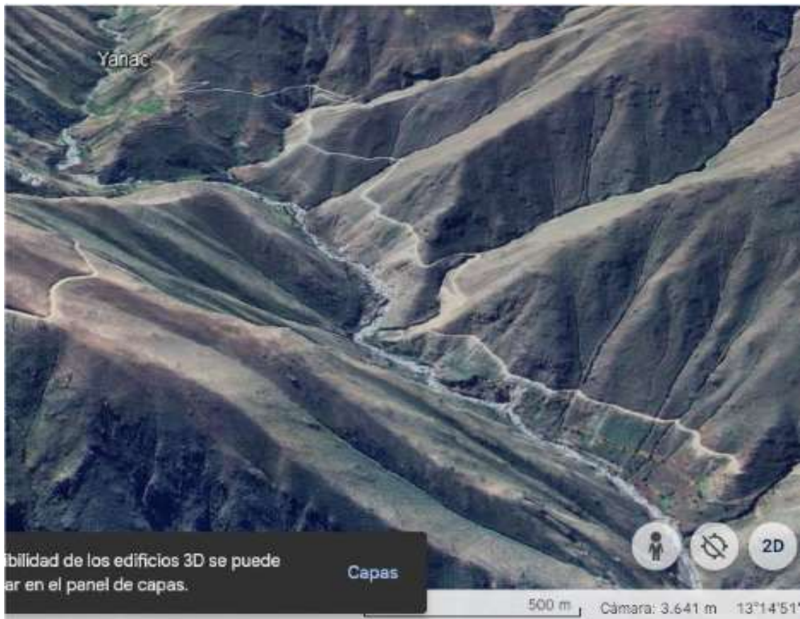
Tramo Torcay Palmayoc (Creación de trocha carrozable, Long. aprox: 9.10 km)