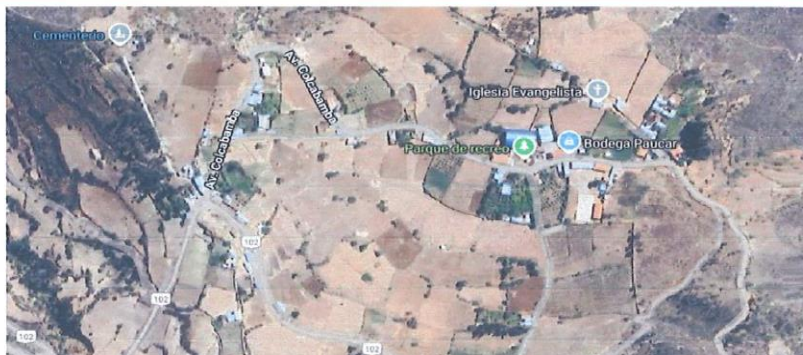
Lugar del proyecto.

El acceso a la localidad de Colcabamba desde la ciudad de Huaraz, se encuentra descrita según el cuadro que a continuación de detalla: