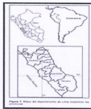
Figura 4. Mapa del departamento de Ica mostrando las provincias