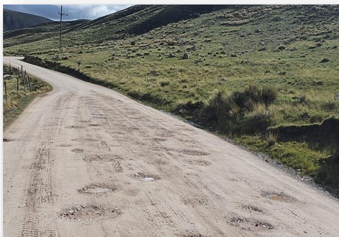
FIGURA N° 06: CONDICIONES ACTUALES DEL PROYECTO

El proyecto se ejecutará en los distritos de Huayhuay y Suitucancha, provincia de Yauli, departamento de Junín, para mejorar la vía carrozable que une estos dos distritos, que a la fecha se encuentra en pésimas condiciones.