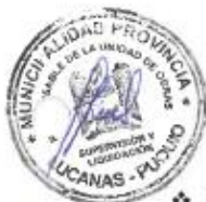
Gráfico N°01: AYACUCHO