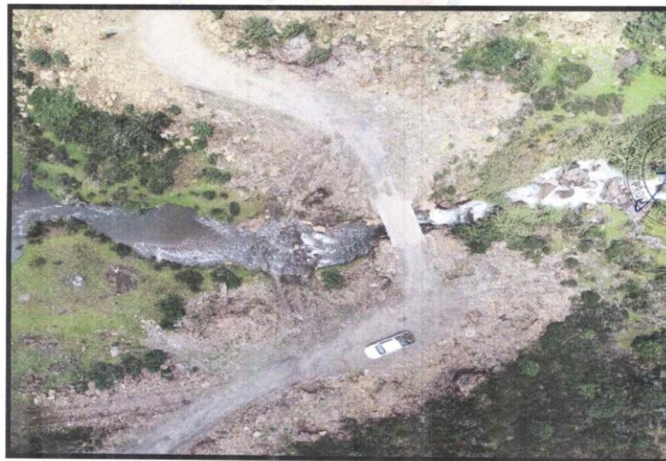
Vista del estado actual del puente Upamayo

Actualmente, el Puente Upamayo está en funcionamiento, pero con MUCHAS DEFICIENCIAS ESTRUCTURALES DEBIDO A LA AUSENCIA DE ASESORAMIENTO TECNICO Y ERRORES EN EL PROCESO CONSTRUCTIVO , siendo estos los problemas más relevantes detectados en la estructura del puente, a ello la suma la antigüedad de los elementos del puente.