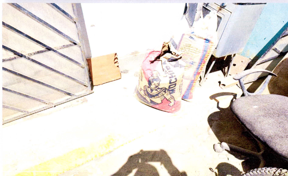
FOTO N°1: Se observa el área de vereda colindante del comedor existente donde se encuentra en regular estado de conservación para su posterior instalación de nuevo piso y acondicionar el ambiente para oficinas requerido por el área usuaria, ubicado en el primer nivel - interior del Local Policial.

Edwin Franklin Juan Guesola ARQUITECTO C.A.P. N° 16958