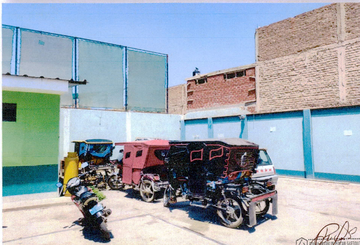
FOTO N°3: Se observa las dimensiones y área a intervenir (acondicionamiento de ambiente) considerando los aspectos técnicos para su posterior funcionamiento el cual es solicitado por el área usuaria, el área se ubicado en el primer nivel - interior del Local Policial.