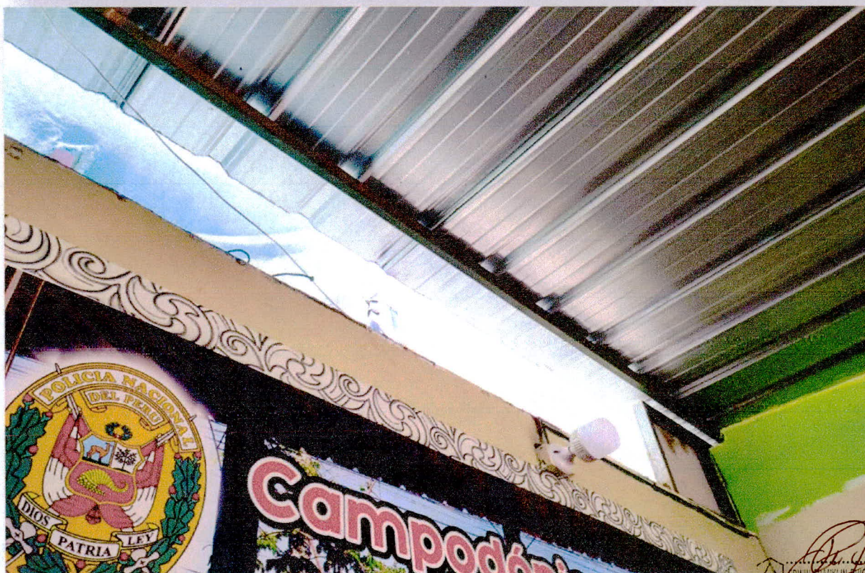
FOTO N°5: Se observa ambiente existente de oficina con estructura metálica expuesta y no cuenta con una buena iluminación, falta de tomacorriente y puntos de red, se propone acondicionar para uso de oficina de participación ciudadana, asimismo se considera instalación de falso cielo raso, instalación de luminarias, instalación de tomacorrientes, entre otros, el cual es solicitado por el área usuaria, ubicado en el primer nivel - interior del Local Policial.

[Signature] EDWIN GARCÍA GARCÍA ARQUITECTO C.A.P. N° 16998