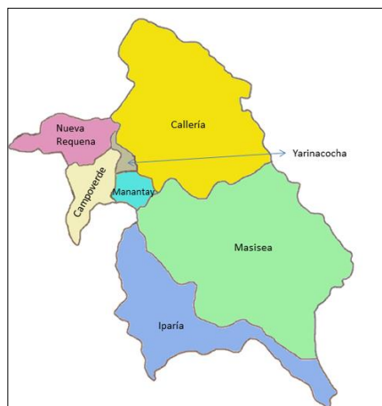
Mapa macro localización de la Provincia de Coronel Portillo