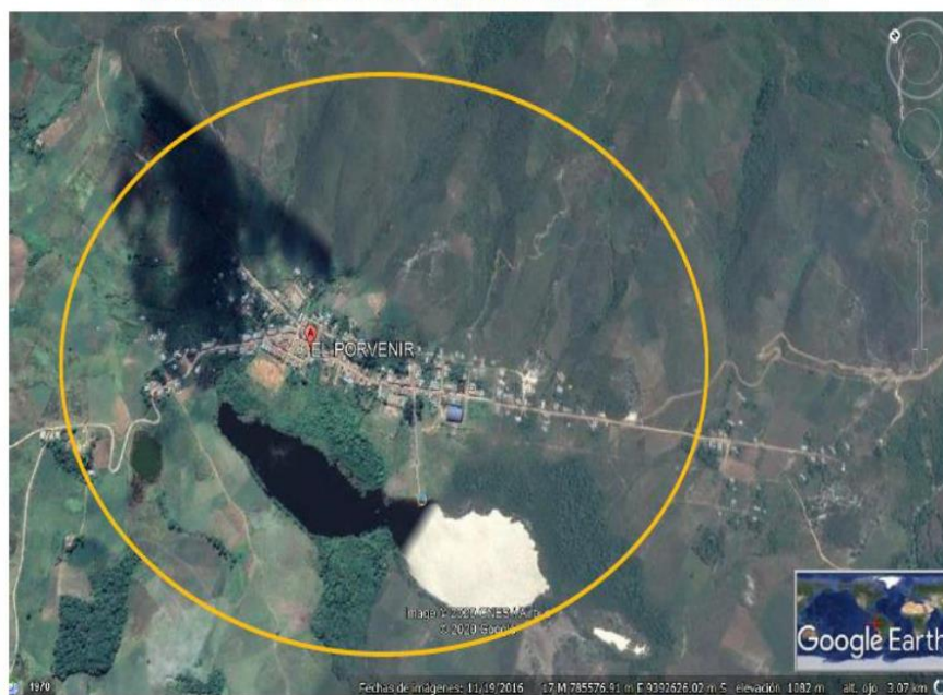
FIGURA N° 03: MICROLOCALIZACIÓN DE LA LOCALIDAD EL PORVENIR.