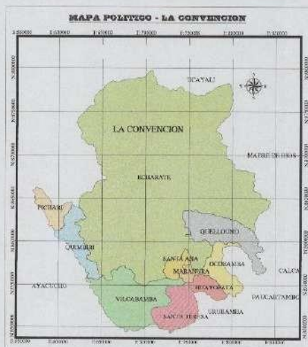
IMAGEN N° 01: LOCALIZACIÓN GEOGRÁFICA