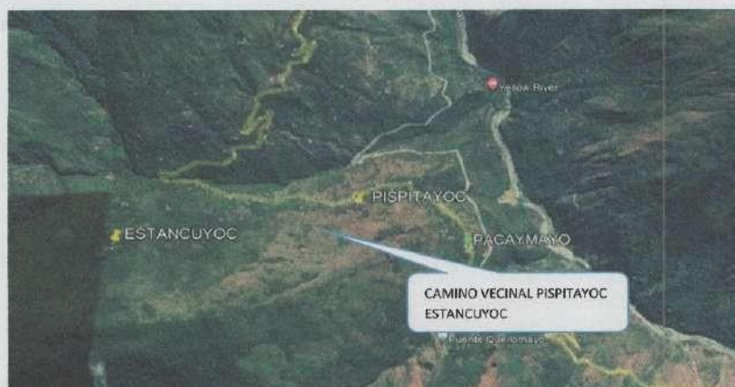
IMAGEN N° 02: UBICACIÓN DEL PROYECTO