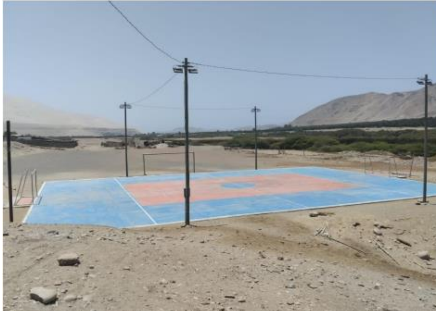
Ilustración 2: Vista de losa existente a intervenir