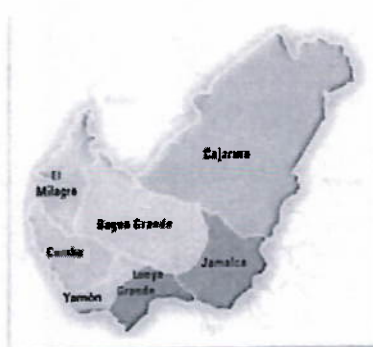
Gráfico N° 03: Mapa Ubicación de (CS. Santa Cruz de Buena Vista, CS. Santa Rosa, CS. los Libertadores, CS. Alto Utcubamba, CS. Acapulco y Cruce Alto Utcubamba hasta el CS. Nuevo Paraíso)