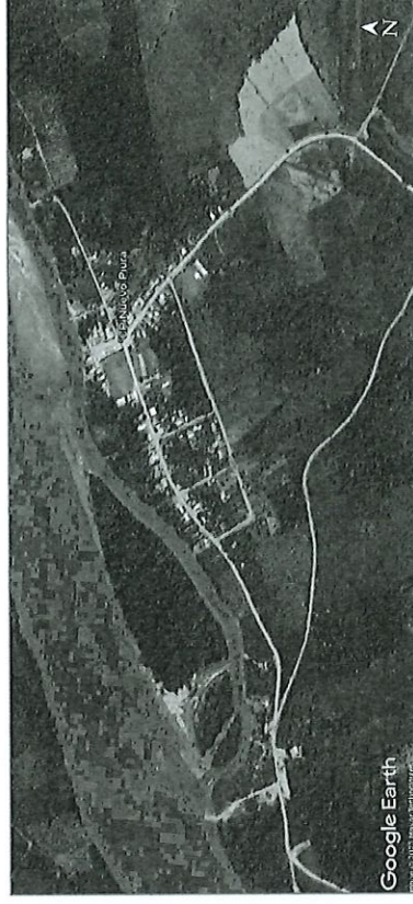
Figura 3. Vista satelital del centro poblado Nueva Piura

Es objeto principal del Estudio es la Elaboración del Expediente Técnico de acuerdo a los lineamientos de la Plataforma de Registro, Evaluación y Seguimiento de Expedientes Técnicos (PRESET) del Ministerio de Vivienda, Construcción y Saneamiento (MVCS), para su financiamiento y posterior ejecución a nivel de obra del proyecto "MEJORAMIENTO Y AMPLIACIÓN DEL SERVICIO DE AGUA POTABLE Y ALCANTARILLADO SANITARIO, EN EL CENTRO POBLADO NUEVA PIURA DEL DISTRITO DE CAMPO VERDE - PROVINCIA DE CORONEL PORTILLO - DEPARTAMENTO DE UCAYALI" con Código Único de Inversión N° 2602324