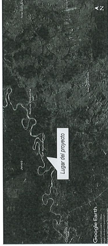
Figura 1. Micro localización del proyecto

Se tiene como antecedente la viabilidad de la Ficha Técnica Estándar: "MEJORAMIENTO Y AMPLIACIÓN DEL SERVICIO DE AGUA POTABLE Y ALCANTARILLADO SANITARIO, EN EL CENTRO POBLADO NUEVA PIURA DEL DISTRITO DE CAMPO VERDE - PROVINCIA DE CORONEL PORTILLO - DEPARTAMENTO DE UCAYALI" con Código Único de Inversión N° 2602324